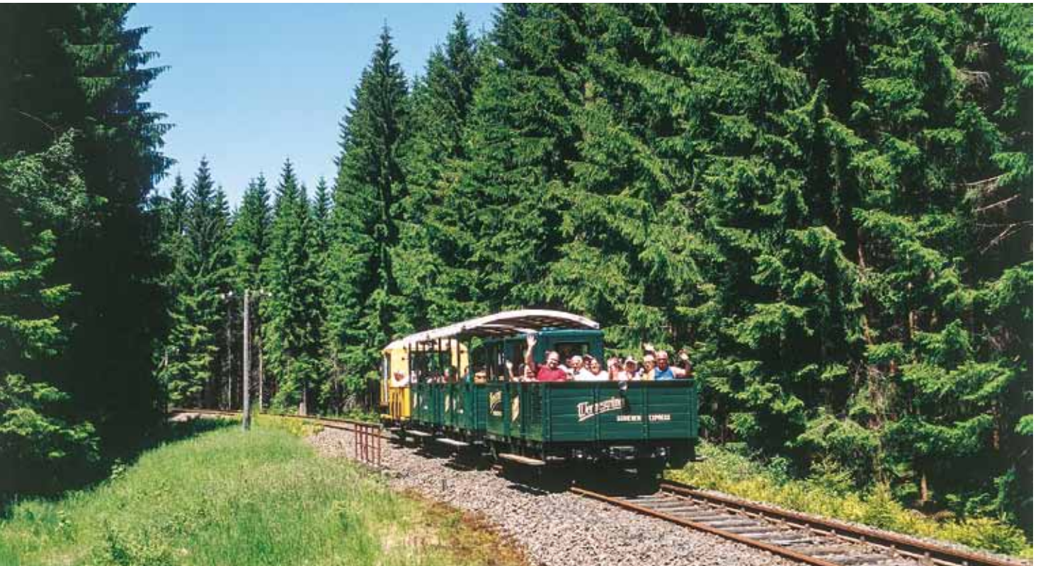
Auch in seiner bisher siebenten Fahrseason erfreut sich der „Wernesgrüner Schienen-Express“ des FHWE bei den Fahrgästen großer Beliebtheit. Am Pfingstsonntag, dem 8. Juni 2014 ist der an diesem Tag als vierteilige Garnitur verkehrende und sehr gut besetzte WEX gerade zwischen den Bahnhöfen Rautenkranz und Schönheide Süd unterwegs.