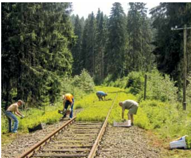
Immer wieder einen sehr hohen Aufwand erfordert die Pflege des in waldreicher Landschaft verlaufenden Streckengleises der CA-Linie zwischen Wilzschhaus und Hammerbrücke. Zwischen Schönheide Süd und Rautenkranz hat der wilde Fichtenbewuchs an einigen Stellen eine derartige Dichte erreicht, dass diese Bäumchen seit Ostern dieses Jahres auf manuellem Wege durch ein Herausziehen samt Wurzelwerk entfernt werden. Am 19. Juli 2014 war die „Bm-Brigade“ gerade rund um den km 78,6 CA in Aktion.