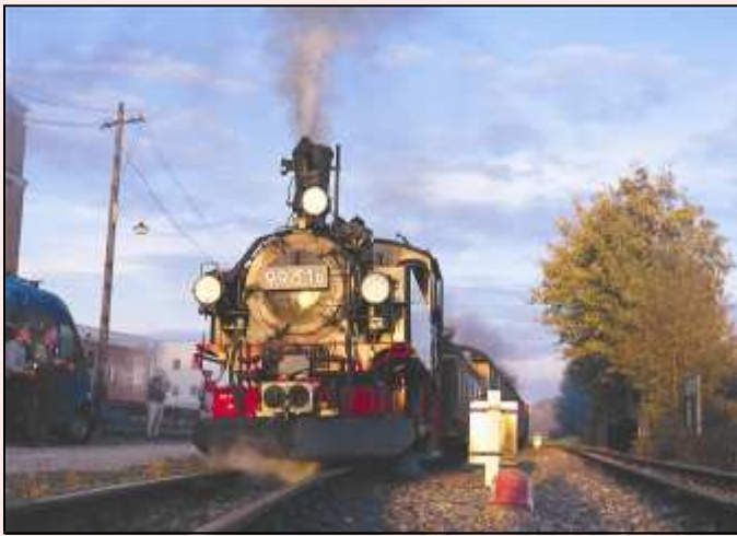
Mit Vollkampf durch den Hochammer. Das I. WCd-Festival 2007!

Bezüglich des nebenstehenden Fahrplans zum I. WCd-Festival ist zu beachten: