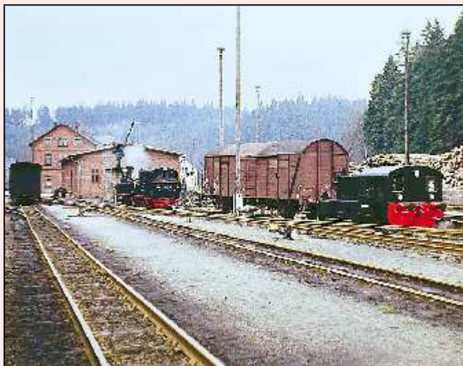
Höhepunkt des I. WCd-Festivals 2007 wird die Einweihung des durch den FHWE wieder aufgebauten Schmalspurteils von Schönheide Süd. Die auch vor 1977 vorhandene Rollwagengrube entsteht bis Juni 2007 neu.